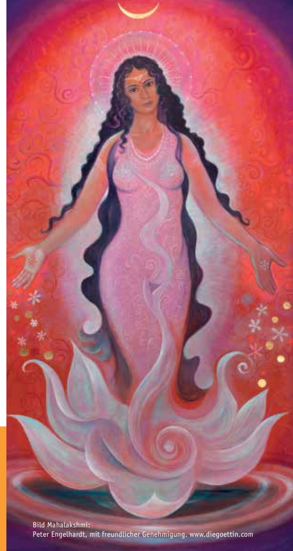
Bild Mahalakshmi: Peter Engelhardt, mit freundlicher Genehmigung. www.diegoettin.com